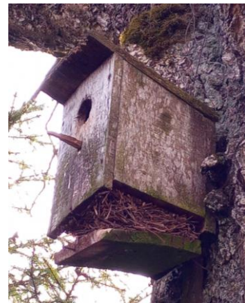
No apakšas piesistas grīdiņas sekas