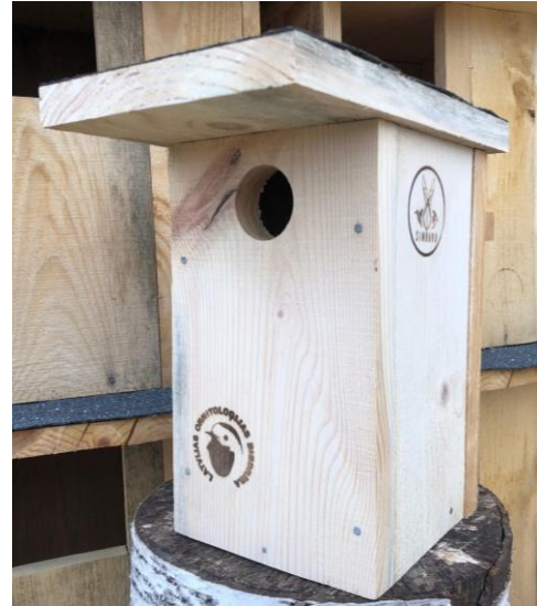
Mājas strazdu būrītis