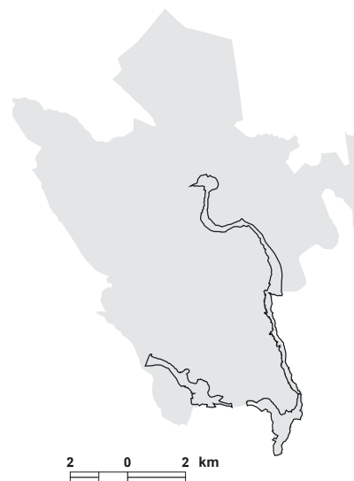
5.33. attēls. Putniem nozīmīgās vietas LV083 Burtnieka pļavas robežu salīdzinājums ar vietas 038 Burtnieks robežām iepriekšējā PNV pārskatā [1].