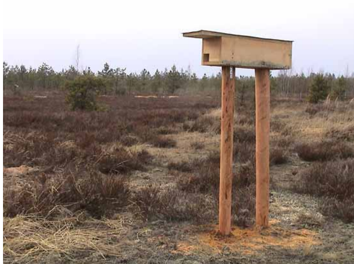
Viens no Ādažu poligonā izvietotajiem pupuķu būriem.

Ādažu poligonā būri tiek stiprināti uz diviem aptuveni 1,5 m augstiem koka mietiem. Būrus var stiprināt arī kokā, pie ēkas vai citā vietā. Ņemot vērā to, ka pupuķi var ligzdot ļoti dažādā augstumā (arī uz zemes), būra augstumu var izvēlēties, katrā konkrētajā vietā meklējot līdzsvaru starp būra drošību (pret kaķiem, cilvēkiem u.c.) un uzturēšanas un kontroles ērtumu.